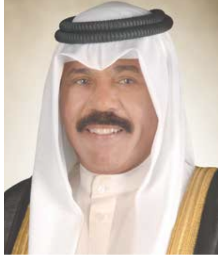
حضرة صاحب السمو الشيخ نواف أحمد الجابر الصباح أمير دولة الكويت