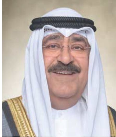
سمو الشيخ مشعل أحمد الجابر الصباح ولي عهد دولة الكويت