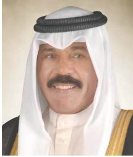
حضرة صاحب السمو الشيخ نواف الأحمد الجابر الصباح أمير دولة الكويت