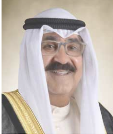
سمو الشيخ مشعل أحمد الجابر الصباح ولي عهد دولة الكويت