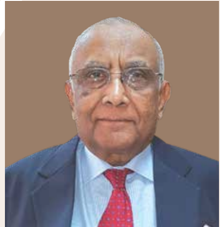
السيد صديقي فريد أحمد الرئيس